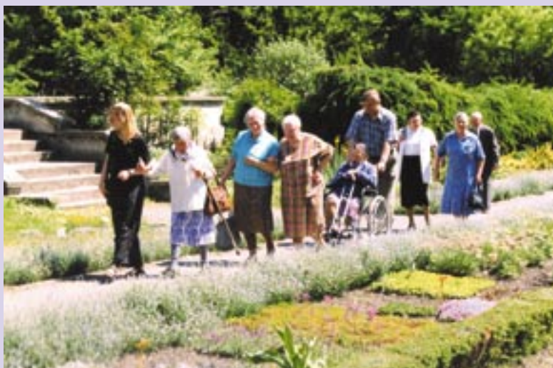
Wycieczka do Ogrodu Botanicznego.