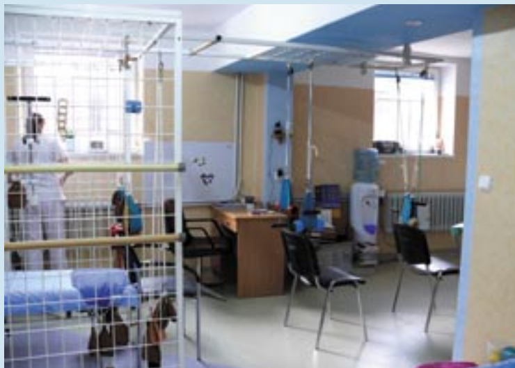
Nowa sala rehabilitacyjna.

lecznictwa, elektroterapii, presoterapii (masażu uciskowego), ultradźwięków, inhalacji oraz leczenia zimnem i ciepłem. Zakupiono także stół do masażu, aquavibron, drabinki gimnastyczne, materace do ćwiczeń, rower stacjonarny, bieżnię, ławeczkę do ćwiczeń oporowych i wiele innych. W ciągu 15 lat pracowało w Betanii 6 rehabilitantek. Obecnie pracują 3 w pełni wykwalifikowane osoby, a rehabilitacja prowadzona jest od 7.00 do 16.00 przez 5 dni w tygodniu. Miniony rok wiele zmienił w dziale rehabilitacji. Rozpoczął się od zmiany wystroju wnętrza