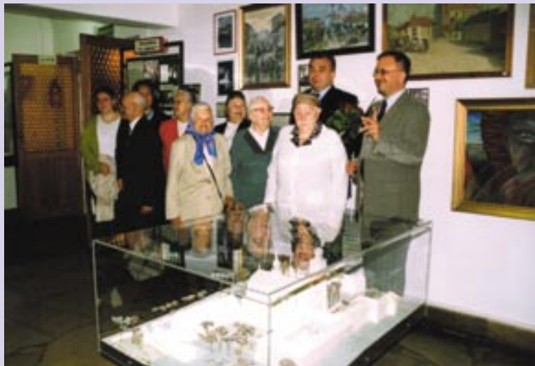
Spotkanie mieszkańców z Burmistrzem Miechowa.