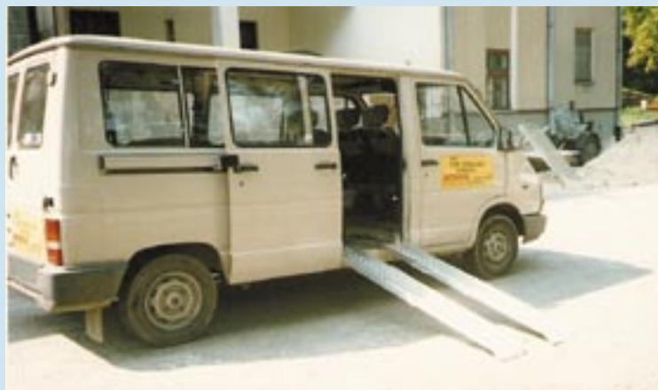
Nasz pierwszy samochód podarowany przez braterstwo Gruhn w 1995 r.

Zakupiono nowy samochód osobowy przystosowany do przewozu osób niepełnosprawnych z zainstalowanym podnośnikiem.