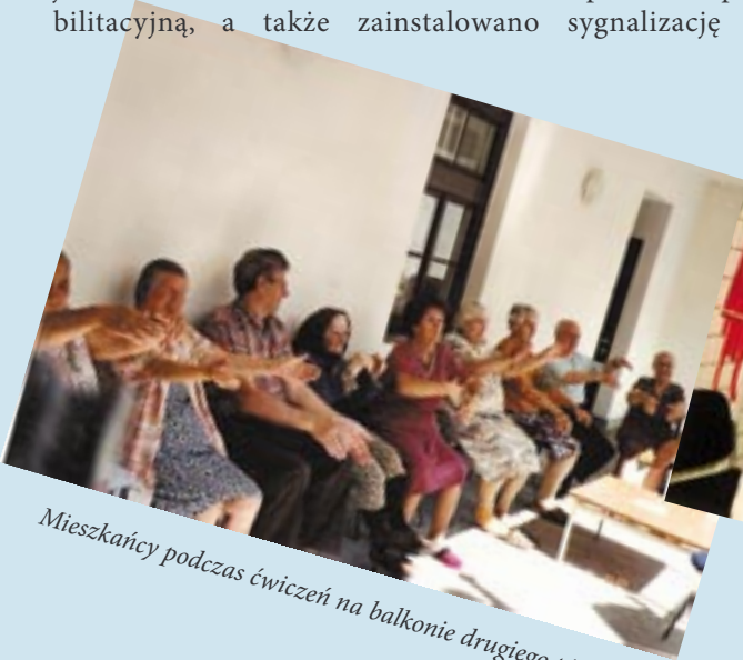
Mieszkańcy podczas ćwiczeń na balkonie drugiego piętra.

4. W 2000 roku przeprowadzono remonty m.in.: odnowiono jadalnię, zbudowano podjazd dla wózków inwalidzkich, zaadaptowano pomieszczenia piwniczne na salę rehabilitacyjną, a także zainstalowano sygnalizację przyzywową w pokojach i łazienkach.