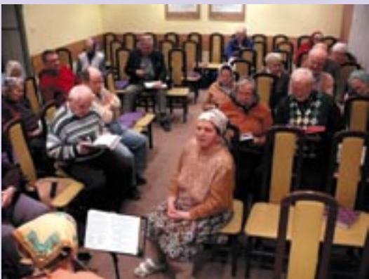
W zimowe, chłodne wieczory spotykamy się na wspólnym śpiewie.