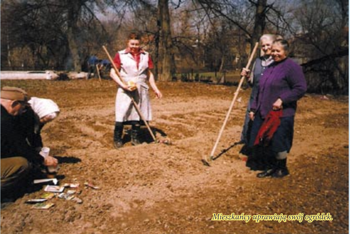
Mieszkańcy uprawiają swój ogródek.

5. W 2001 r. wykonano plac i chodniki z kostki brukowej, a także zagospodarowano część ogrodową, na której zbudowano altankę.