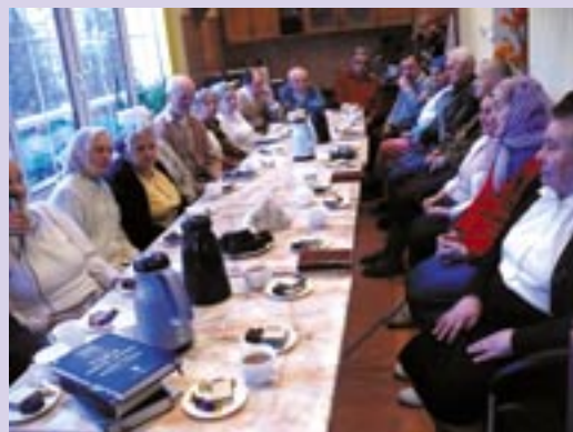
Mieszkańcy podczas spotkań „gościnnych”, gdzie rozważane jest Słowo Boże.