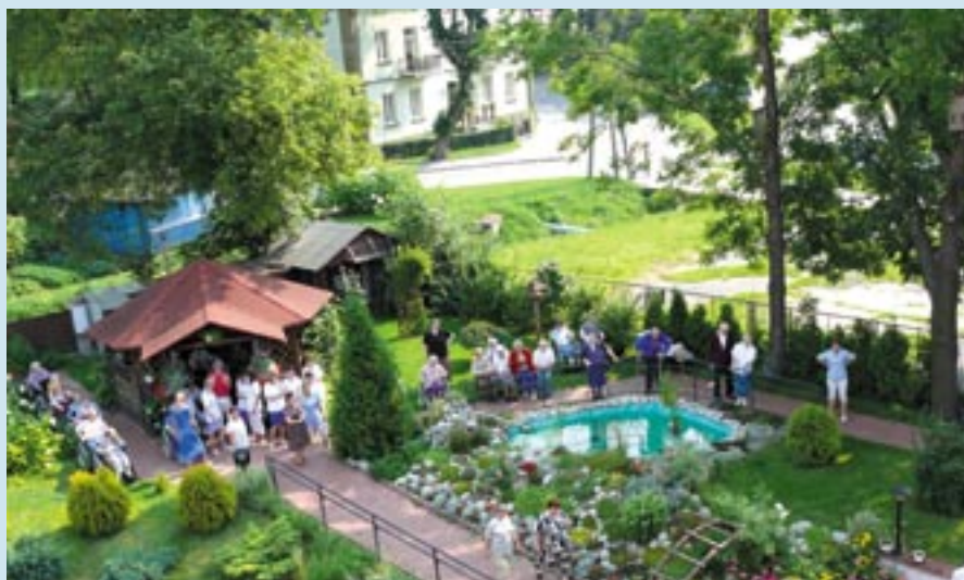
Nasz ogród z „lotu ptaka”.

6. W 2002 r. zabudowano balkon na II piętrze i zamontowano klapy oddymiające z elektrycznym systemem oddymiania i przewietrzania.