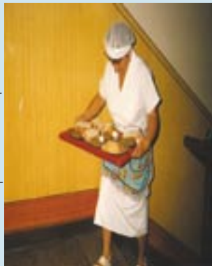
Dawniej posiłki wynoszone były po schodach.

Dziś korzystamy z barmara, którym rozwożone są ciepłe posiłki.