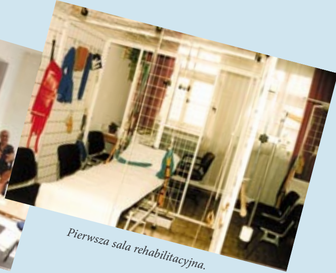
Pierwsza sala rehabilitacyjna.