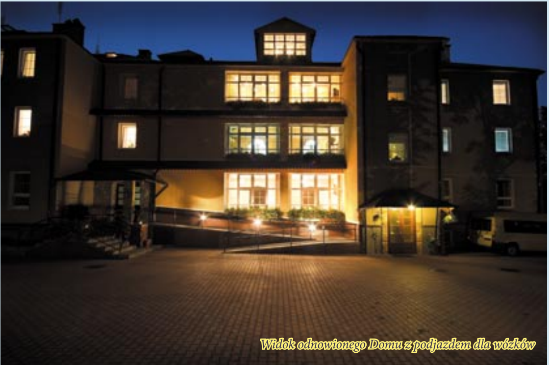
Widok odnowionego Domu z podjazdem dla wózków