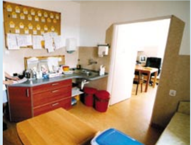
Odnowiona dyżurka pielęgniarstwa.

10. Z otrzymanych dodatkowych dotacji w latach 2006 – 2008 wykonano: