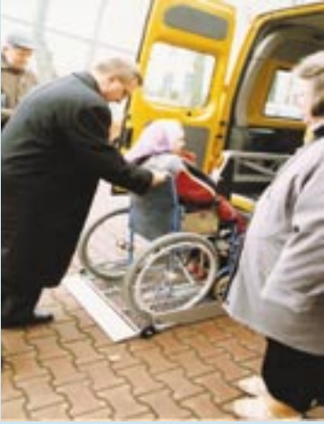
Nowy samochód z podnośnikiem na wózki.