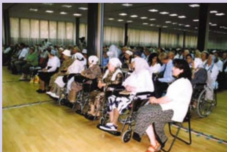
Mieszkańcy na Konwencji Generalnej.