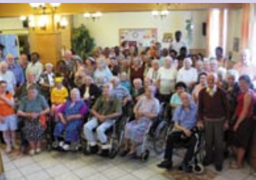
Wizyta braci z dalekich Indii.

„Ozdobą domu są przyjaciele, którzy do niego uczęszczają”