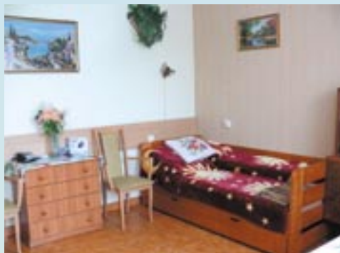
Odnowione pokoje mieszkańców i zakupione szafki.