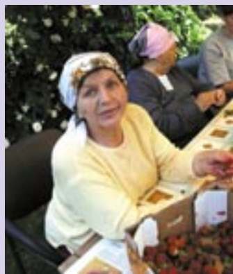
Mieszkańcy chętnie pomagają w przygotowaniu przetworów na zimę.

Latem spędzamy czas w ogrodzie i wspólnie grillujemy.