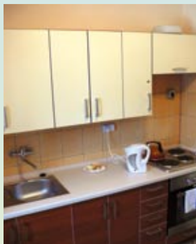
Odnowiona kuchenka podręczna.